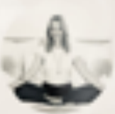
Natascha St Pier